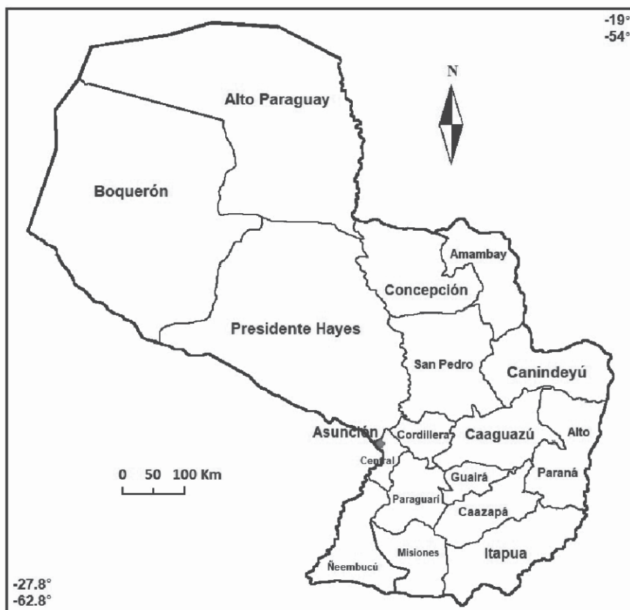
Fig. 1. Mapa del Paraguay en el cual se indican los departamentos.